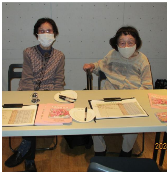
計 190 歳の受付当番、尊敬！感謝！